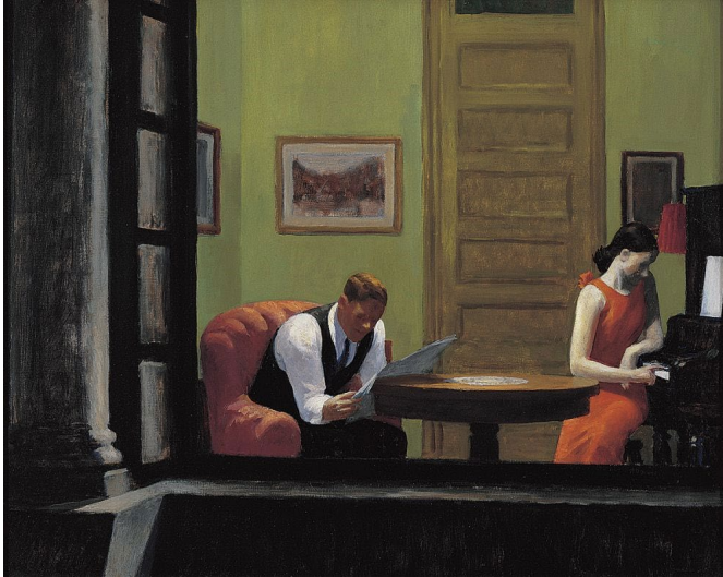
Kamer in New York – Edward Hopper (1932)

'Ouders hebben niet langer het gezag om weerstand te bieden aan de grillen en verlangens van hun kinderen. En dat is wel noodzakelijk, want kinderen en jonge mensen zijn nog geen personen, ze hebben allerlei sturing en discipline nodig. In Frankrijk heeft de regering smartphones op scholen verboden, een teken dat de overheid moet bijspringen om ouders en kinderen weerbaar te maken tegen de inmenging van markt en technologie.'